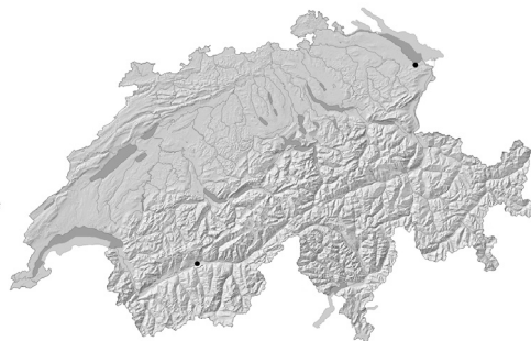
E. Ranunculus rionii Lagger. Dernières observations en Suisse en 1994 (Thurgovie) et 1997 (Valais).