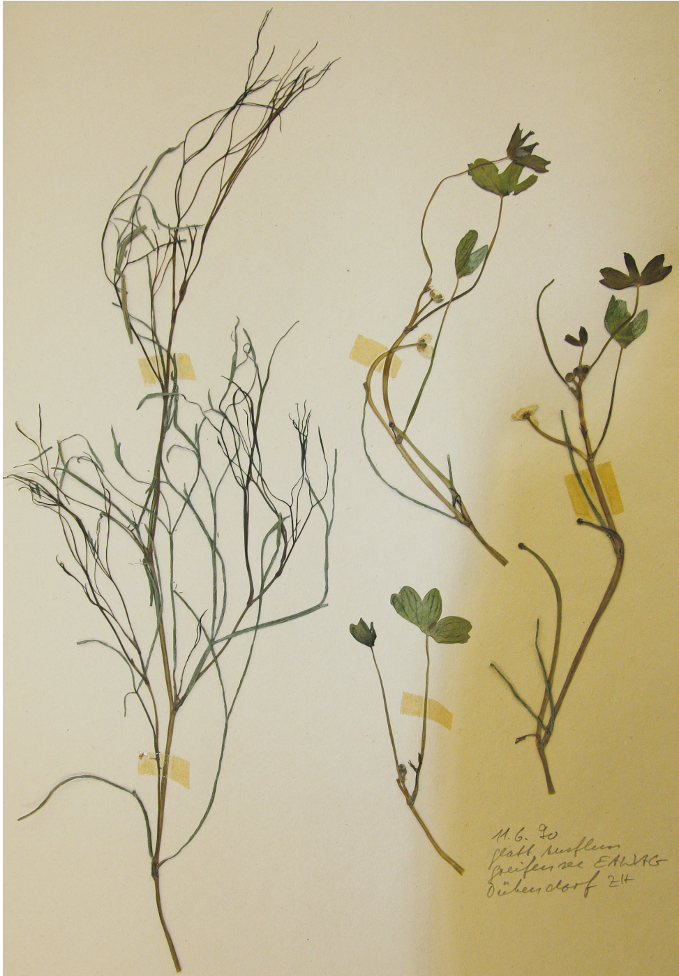
Figure 1. Ranunculus penicillatus (Dumort.) Bab. Greifensee: Glatt Ausfluss, EAWAG aquatic research, 11.6.1990.