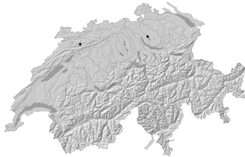
C. Ranunculus penicillatus (Dumort.) Bab. Dernières observations en Suisse à Moutier (1959) et au Greifensee (1990).