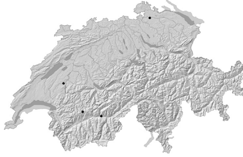
A. Ranunculus aquatilis L. Distribution actuelle en Suisse.