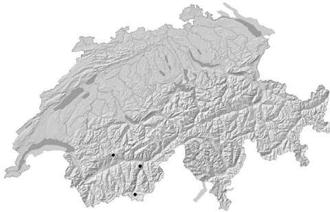
B. Ranunculus peltatus Schrank. Distribution actuelle en Suisse.